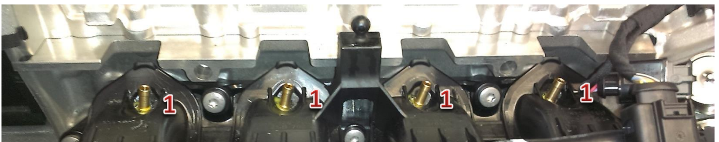
1-dysze wtryskiwaczy gazu/gas injector nozzles